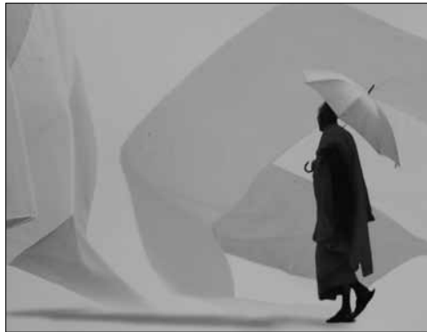
Not ready to accomplish සුධාකර මොල්ලිගොඩ